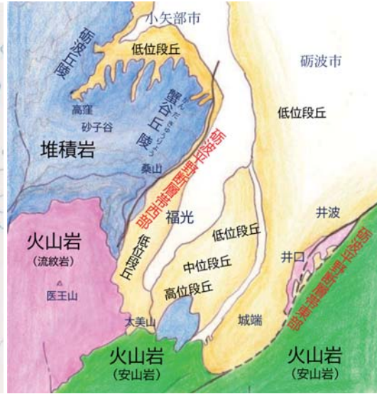
図2「砺波平野断層帯周辺の地質図」 5km

m東の砺波平野断層帯東部「高清水断層」の活断層の存在である。さらに近傍(金沢市)には森本・富樫断層帯があり、いずれの活断層によっても能登半島地震に近い規模の大地震が発生する恐れがある。また最近特に南海トラフ巨大地震の発生による影響が心配されているが、私もそのひとりである。