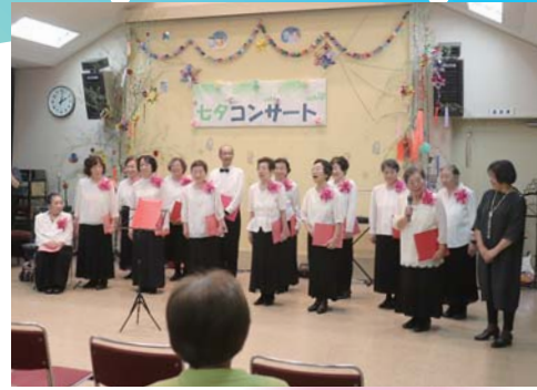
鶴友会合唱クラブ