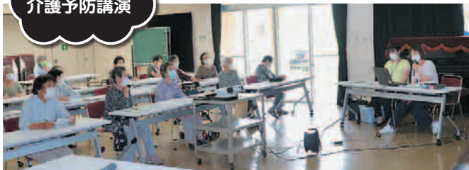
ほっとあっと なんと体操