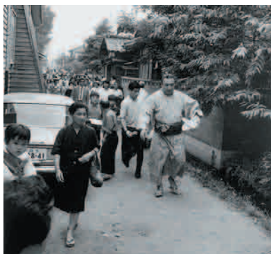
大相撲・福光巡業一横綱 柏戸