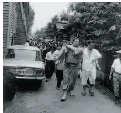
大相撲・福光巡業一横綱 大鵬