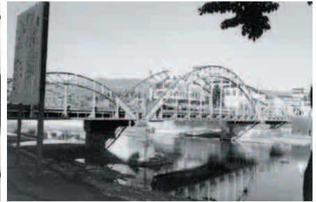
S5 竣工 アーチの福光大橋 荒木側から (S48.6 撮影)