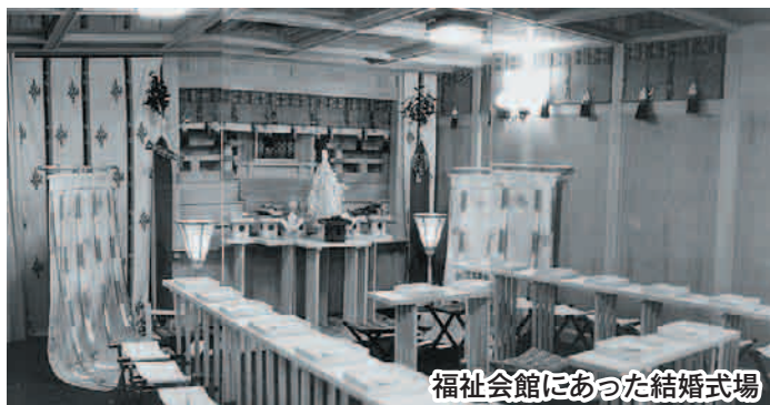
福社会館にあった結婚式場

6月3日(水)から、3と8の付く日に福社会館前で「にぎわい朝市」を行っています。必ずマスクをして来ていただき、お買い物してください。