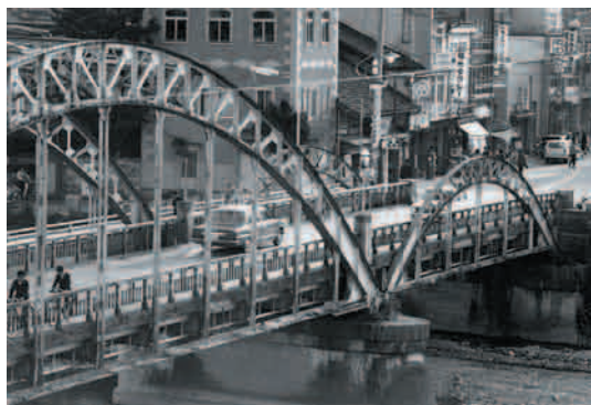
S5 竣工 アーチの福光大橋 荒木側から (S48.6 撮影)