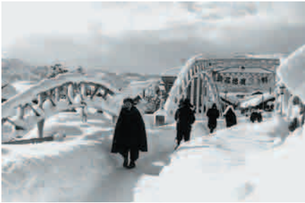
S38 豪雪 福光大橋