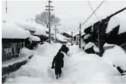
S38 豪雪 西町