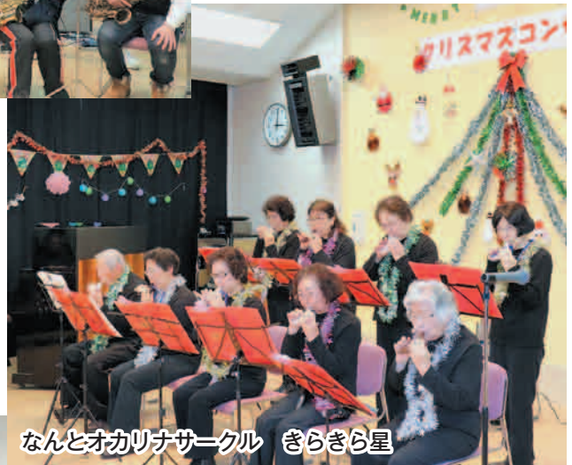
なんとオカリナサークル きらきら星

12月14日(土)午後2時から福光交流センターにてクリスマスコンサートを開催しました。午前中の準備の時はいいお天気でしたが、午後から雨が降ってきて観客の皆さんに来ていただけるか心配でしたが、用意した90席がうまり楽しんでいただき無事に終わることが出来ました。出演者の皆さん、生涯学習部の皆さんありがとうございました。