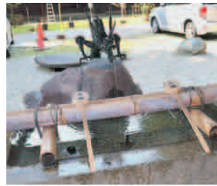
手水舎 (龍の吐水口)